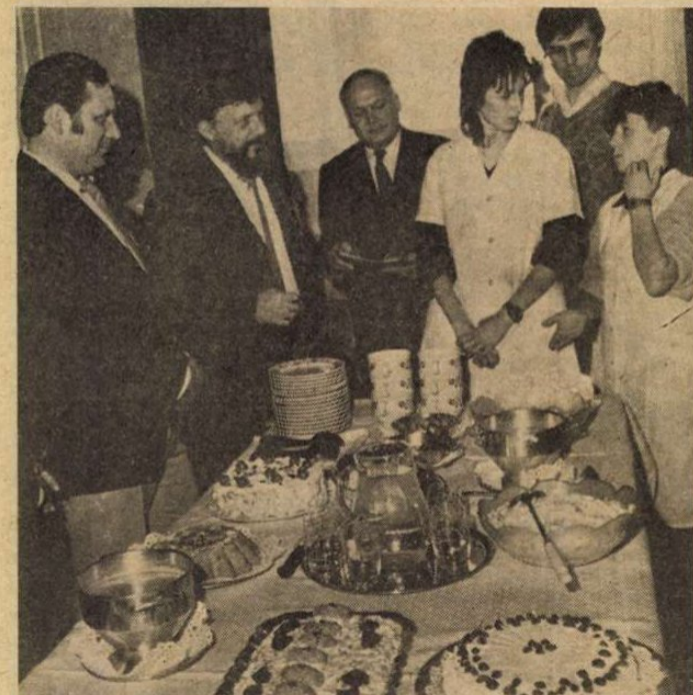
Az asztalon orosz ételek.