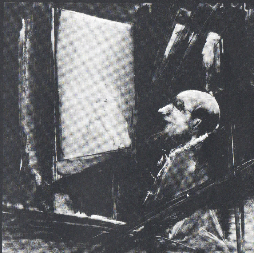
▲ A FESTŐ